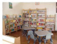
Biblioteca Ragazzi - particolare

CAUSALE: ART BONUS - EROGAZIONE LIBERALE PER COMUNE DI BARZIO - SOSTEGNO A BIBLIOTECA COMUNALE - (INSERIRE CODICE FISCALE O PARTITA IVA MECENATE)