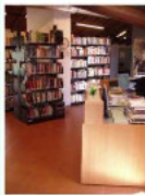
Biblioteca - interno

La Biblioteca Comunale di Barzio è un luogo della Cultura che da più di 40 anni è punto di riferimento per un numero sempre più crescente di cittadini. Da sempre è frequentata e apprezzata grazie all'accoglienza del luogo, alla disponibilità degli operatori e soprattutto alla qualità e alla varietà del suo patrimonio costantemente aggiornato.