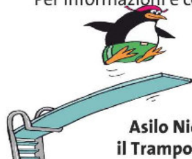
Asilo Nido il Trampolino

Per informazioni e costi rivolgersi alla scuola materna