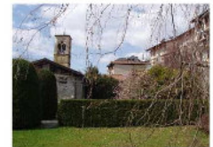
Giardino della Biblioteca - particolare