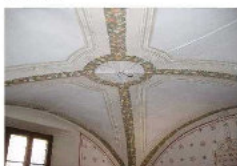
Volta della sala in restauro

CAUSALE: ART BONUS - EROGAZIONE LIBERALE PER COMUNE DI BARZIO - RESTAURO SALA PRESSO PALAZZO MANZONI - "CODICE FISCALE O PARTITA IVA DEL MECENATE"