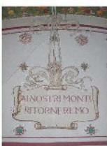
Particolare della sala in restauro

Prima fra le residenze dei Manzoni fu abitato negli anni del Cinquecento dai papisti pié Giacomo e rimase alla discendenza del figlio Pasquino (da cui discenderà Alessandro Manzoni) fino al 1708 quando Pietro si trasferì al Caleotto di Lacco. Nell'800 fu acquistato dai Benaffrati che lo cedettero alla Perrocchia (1973) per poi diventare di proprietà comunale nel 1982. Dal 1930 l'edificio è Monumento Nazionale.